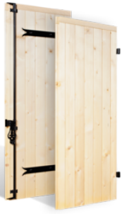
VOLETS BATTANTS 32mm GARDOIS en BOIS