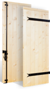
VOLETS BATTANTS 32mm à CLÉS en BOIS