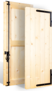
VOLETS BATTANTS 59mm DAUPHINOIS en BOIS